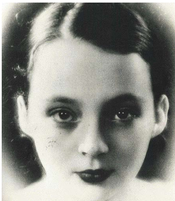
M. Duras : « Là, j'ai dix huit ans »

1973 > Michel Platini a 18 ans : début d'une carrière professionnelle