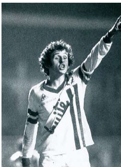
Photographie issue de Ma vie comme un match , Michel Platini, éd. Robert Laffont - Paris, 1987.

Geoffroy Guichard - Girès, H comme le Heysel - Hidalgo, I comme Italie, J comme Juventus - Jeu, K comme Kopa, L comme Lorraine, M comme Mexico, N comme Nul - Nancy,