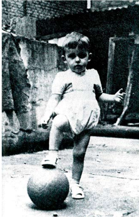
Photographie issue de Ma vie comme un match , Michel Platini, éd. Robert Laffont - Paris, 1987.