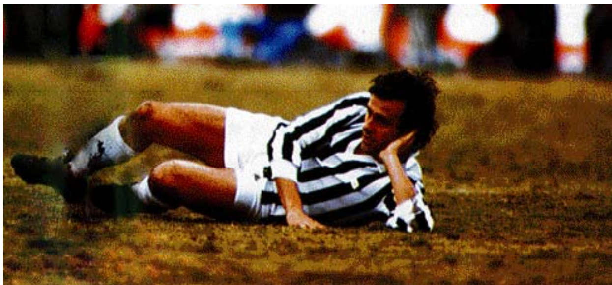
Photographie issue de Ma vie comme un match , Michel Platini, Ed. Robert Laffont - Paris, 1987.