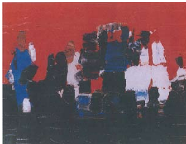
Footballers , Nicolas de Staël, 1952

« Le football est fait d'erreurs parce qu'un match parfait c'est zéro/zéro. Si personne ne fait d'erreurs c'est zéro/zéro. »