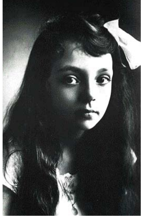
Photographie issue de Marguerite Duras. Les yeux verts , Cahiers du cinema 312/313, éd. Serge Daney - Paris.